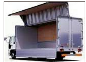
工業製品の密着剤として