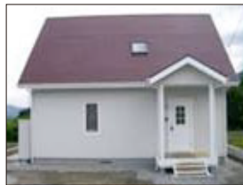
外壁・室内塗装の塗替え