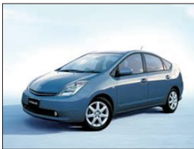
交換パーツの塗替え