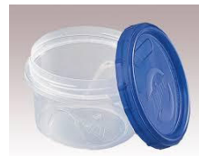
PP製樹脂容器に液剤を入れる